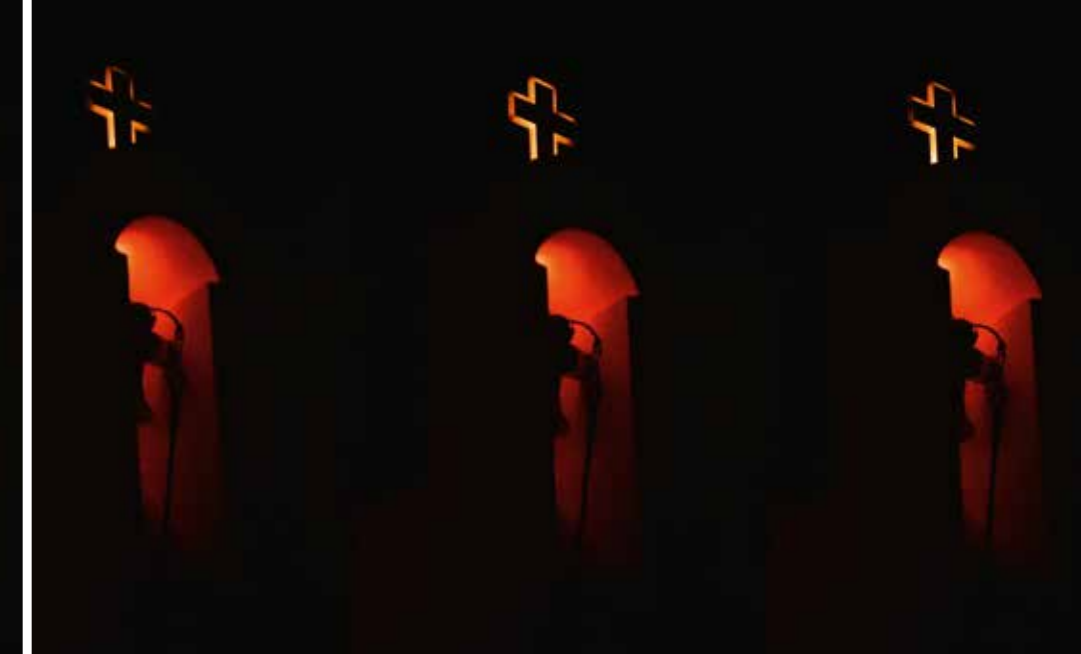
Abb.: Glockenturm mit dynamischer Beleuchtung der Kreuzkontur an der Kapelle der Gottesmutter.

aufgrund kreativer Lichtsteuerung im Rhythmus einer kontemplativen Melodie geführt hat. Der visuelle Inhalt der kunstvollen Projektionen auf der Fassade der Kirche des Heiligen Charalambos wurde von den Erlebnissen der Einwohner im Zusammenhang mit den wohltuenden Wirkungen des Heiligen auf ihr Leben inspiriert.