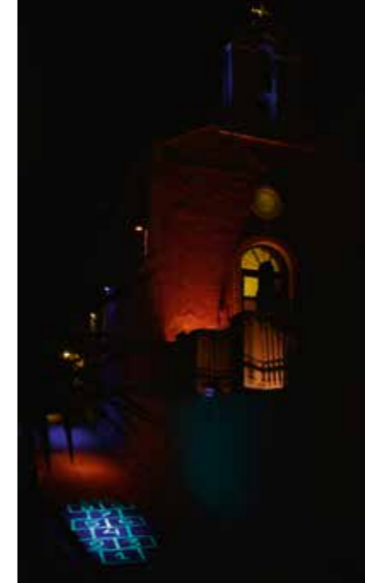
Abb.: Kapelle des Erzengels Michael mit phosphoreszierendem Hüpfspielmuster.